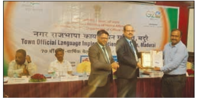
मदुरै अंचल (तृतीय पुरस्कार)