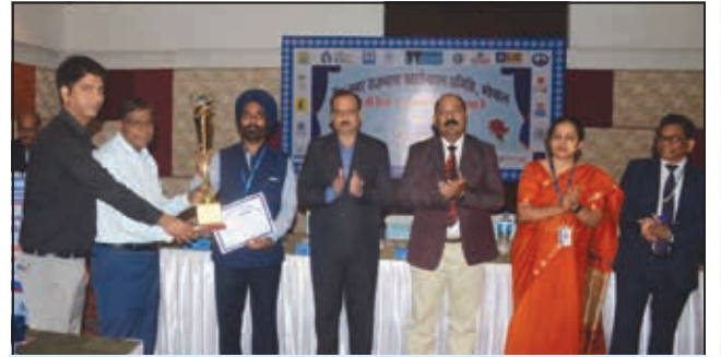
भोपाल अंचल (प्रथम पुरस्कार)