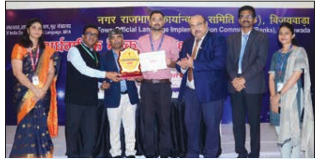
विजयवाडा अंचल (द्वितीय पुरस्कार)