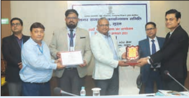
सूरत अंचल (प्रथम पुरस्कार)