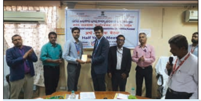
कर्मल शाखा, विजयवाडा अंचल (द्वितीय पुरस्कार)