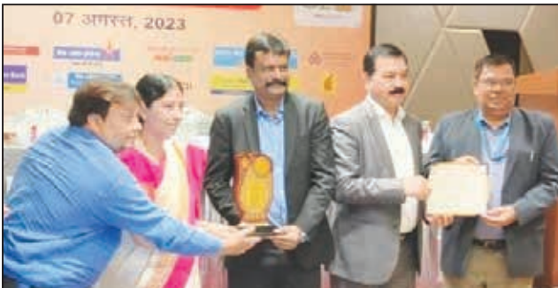
वडोदरा अंचल (प्रथम पुरस्कार)